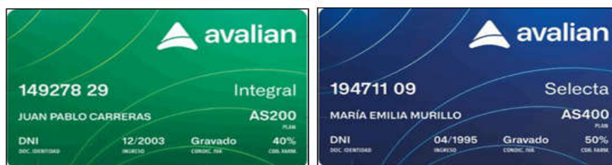
Exclusivo Plan PMO