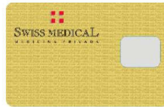
Cred. SMG Oro