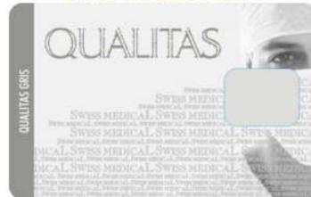
Cred. Qualitas Gris