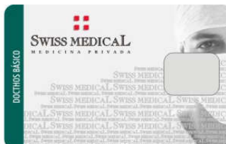
Cred. Docthos Básico