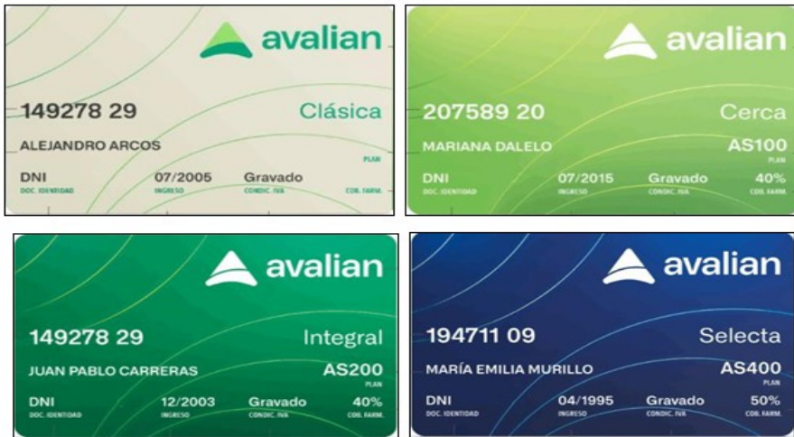
Exclusivo Plan PMO