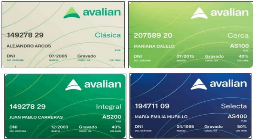
Exclusivo Plan PMO